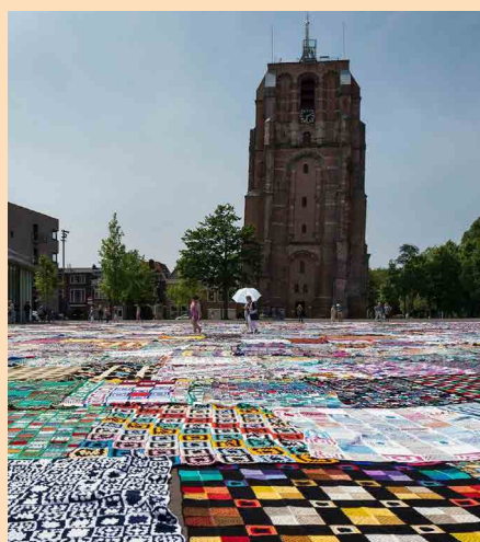
Haak ook aan bij de Grootste Gehaakte Deken: https://www.facebook.com/GGDW2018/