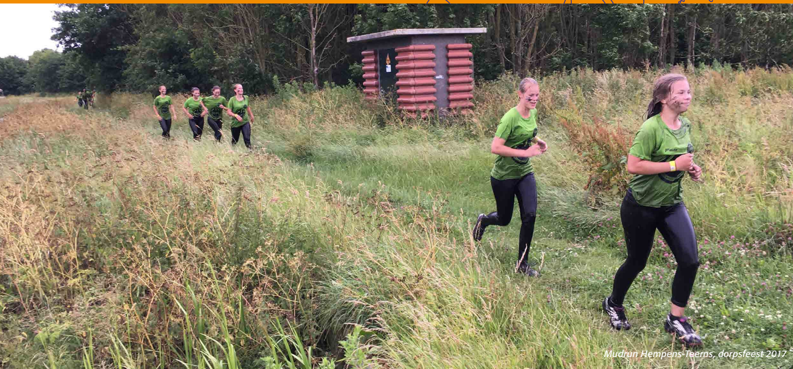
Mudrun Hempens-Teerns, dorpsfeest 2017